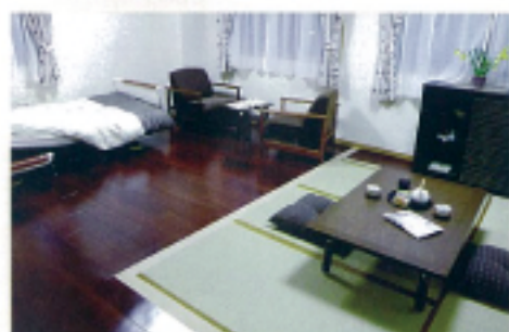
畳コーナー付きの部屋(2人入居も可能)

アグレはサービス付き高齢者向け住宅です。共同住宅で過ごしていただくためのルールはありますが、基本的にはマイホームとしてご自身らしく、自由にお住まいいただけます。外出・外泊も自由、ご家族やお友達も気軽にお招きいただけます。自宅としてのびのび暮らしつつ、ご希望に応じて必要な生活サポートを受けられる、安心の住まいです。