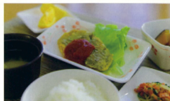
手作りのお食事(トレイでご提供します)

介護保険外での通院介護・散歩・掃除や買い物代行などのサービスを希望される方への生活支援(有料)。