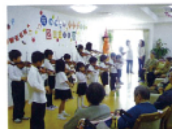
③ 子どもたちとの交流会