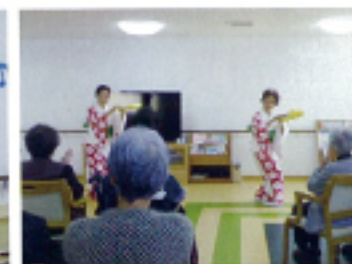
⑧ 民政委員さんとの交流会