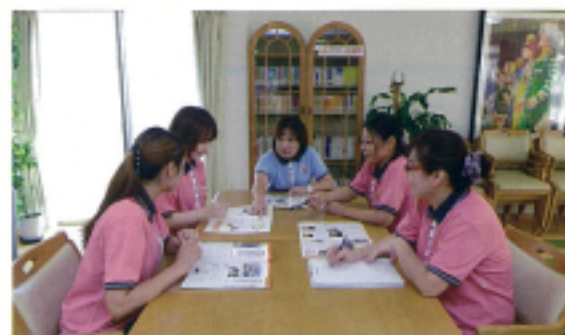
介護専門スタッフがサポートします

健康相談やバイタルチェックなど、生活支援スタッフが毎日の暮らしをサポートします。