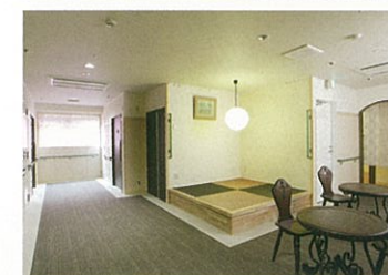
カフェスペース「和の間」