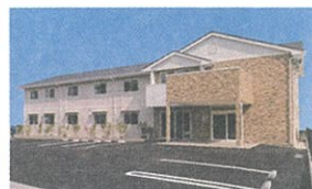
15 グループホーム すみよしの憩