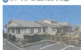
24 グループホーム おおさとの憩