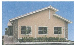
6 グループホーム とよやまの憩