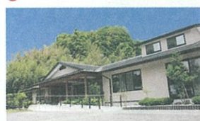
18 グループホーム ぎらみの憩