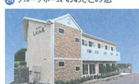
26 グループホーム じゅうじょうの憩