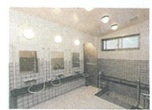
一般浴室 特別浴室

浴室 明るく広い浴室で心地よく疲れを落とせます。 また、介護度の高い方にも安心の設備。