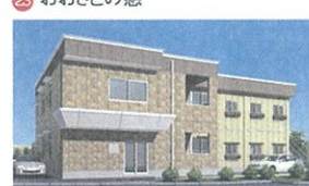
25 グループホーム わかぎの憩