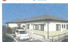
22 グループホーム おかのみやの憩