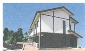
20 グループホーム いわむらの憩