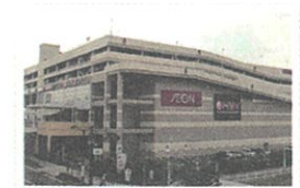
○イオンナゴヤドーム前 ショッピングセンター