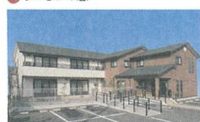
21 グループホーム あおいの憩