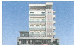
10 ハイリタイヤー名城