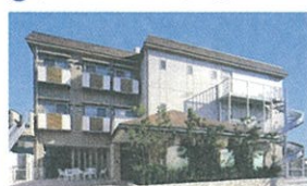
17 ハイリタイヤー多治見