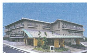
11 ハイリタイヤー21南山