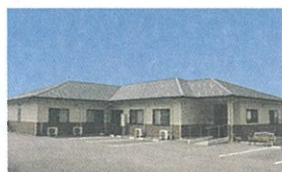
12 グループホーム ひこねの憩