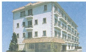
7 ハイリタイヤー松葉公園