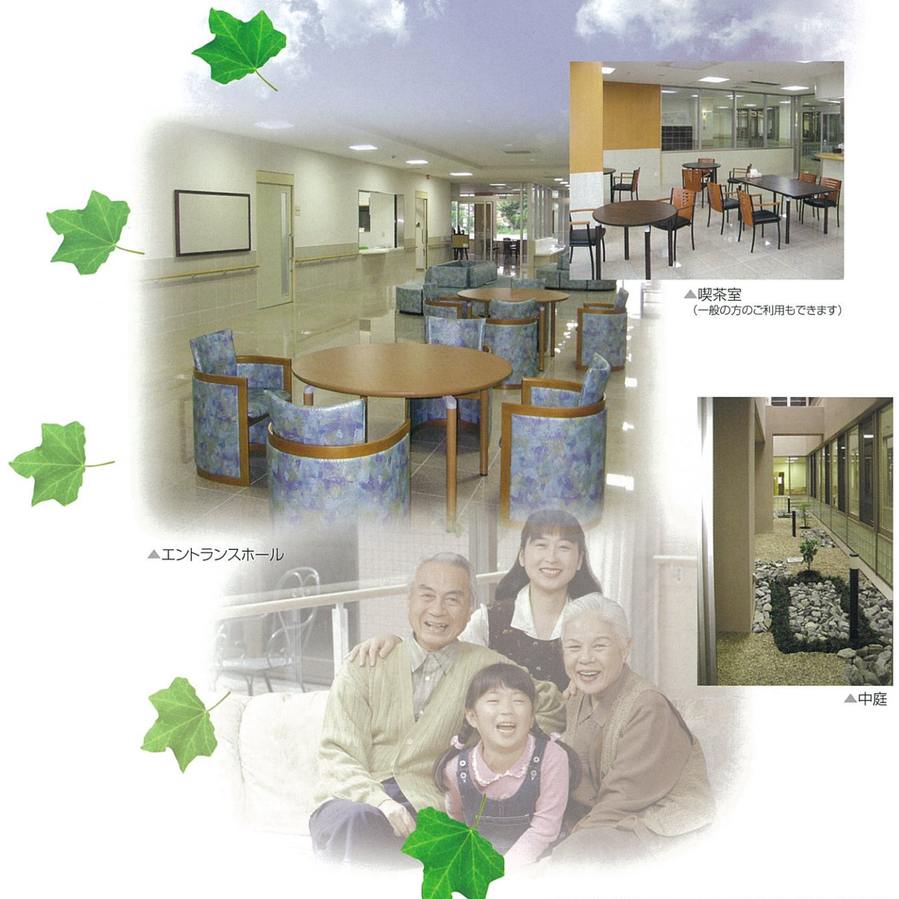
▲喫茶室 (一般の方のご利用もできます)