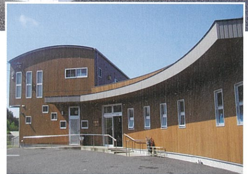
いきいきデイサービス細野

完成予定図 愛知県春日井市細野町大久手3098 いきいきデイサービス細野の隣です。