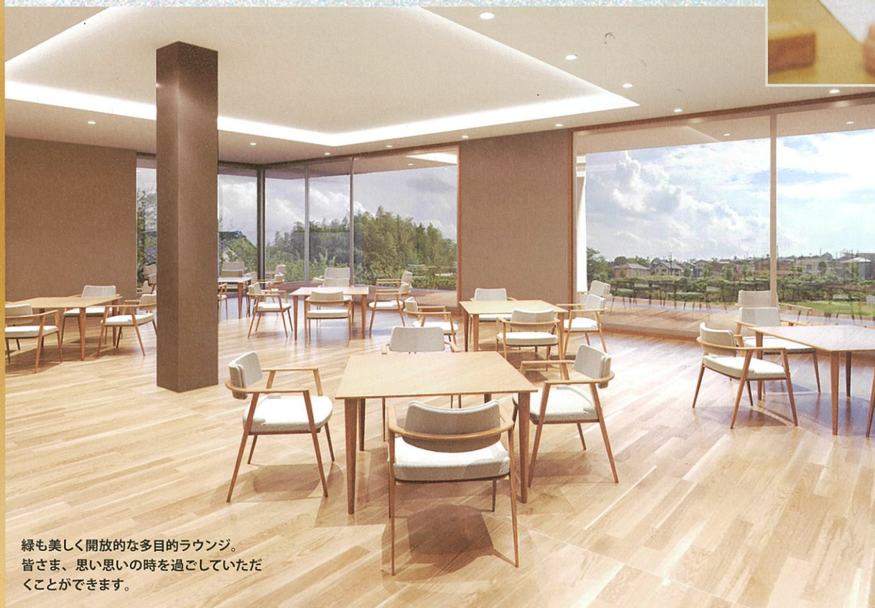
緑も美しく開放的な多目的ラウンジ。 皆さま、思い思いの時間を過ごしていただくことができます。