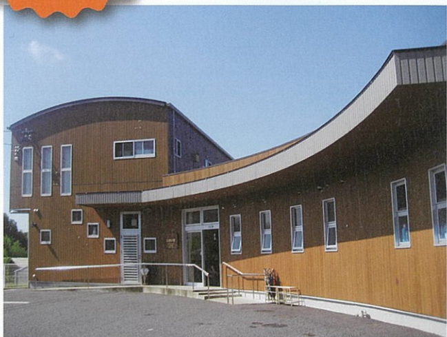
いきいきデイサービス細野