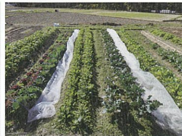
毎日の食事には、隣の畑で採れた無農薬野菜をふんだんに用いています。