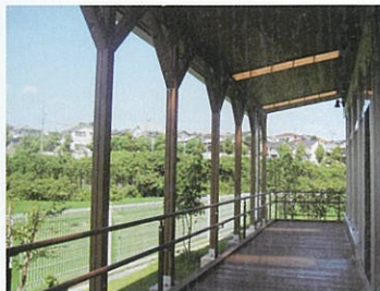
豊かな緑、風のそよぎを満喫できると人気のウッドデッキ。