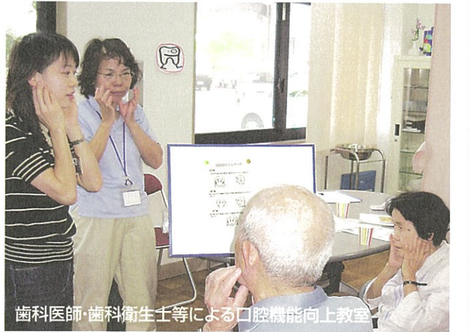
歯科医師・歯科衛生士等による口腔機能向上教室