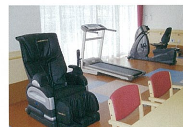
リハビリマシーン