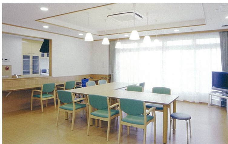
ユニットリビング

プライバシーを守りつつ、ご入居者とスタッフがお互いになじみの関係を築きながら家庭的で温かい生活をお過ごしいただきます。たんぼ菱野の里は一人一人が生きてこられた人生、生活習慣、価値観を大切にします。