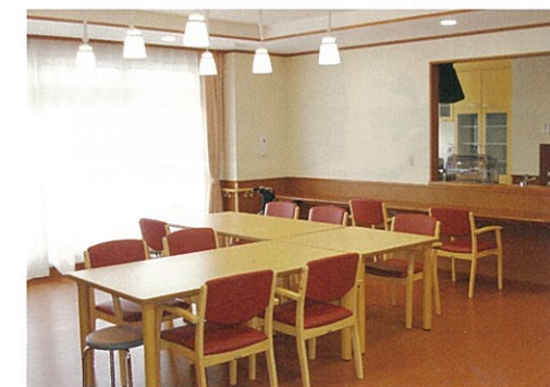
ショートステイリビング