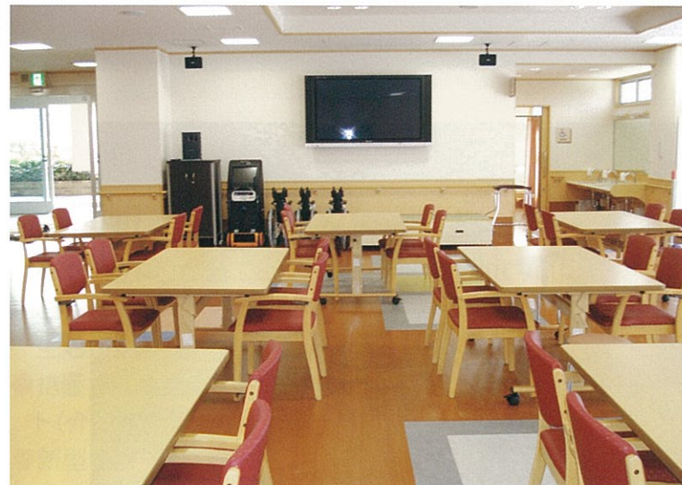
デイサービスセンター