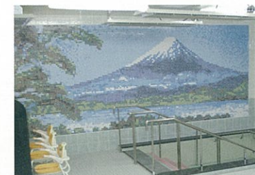
デイサービスセンター 浴室