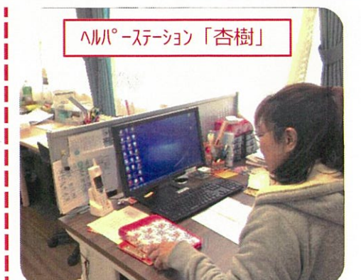
ヘルパーステーション「杏樹」