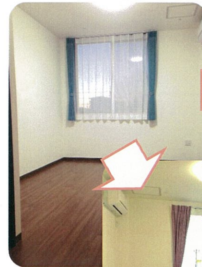
【一般居室イメージ】