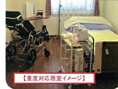
【重度対応居室イメージ】