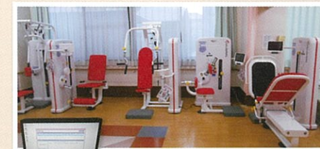
コンピューターでデータ管理