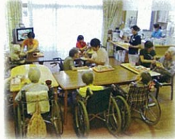
ユニット内リビング