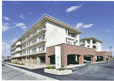
特別養護老人ホーム