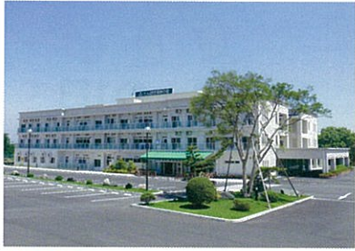
特別養護老人ホーム