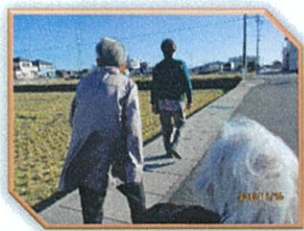
えもり周辺を散歩・・・