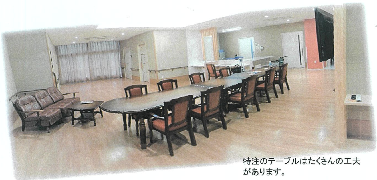
特注のテーブルはたくさんの工夫があります。