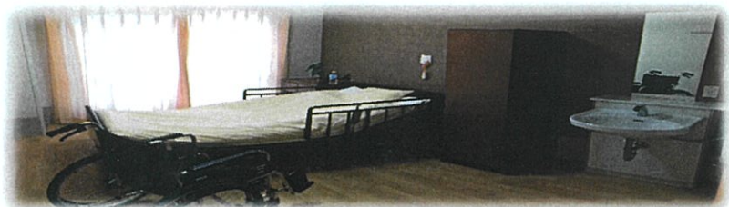
個室には洗面とクローゼット。 その方に合わせて3種類のベッドを揃えています。