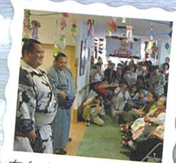
有名力士とのふれあい

また、複合施設が隣接する好立地なので、 徒歩で買物に出かけられる環境です。 スタッフが同行したり、面会のご家族様と 出かけたりと楽しみが広がります。