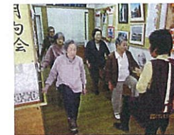
リフレッシュ体操

シニアホームあかねではチームワーク・アットホームを大切に、楽しく不安のない生活を提供できることを目指し、全職員で日常生活をサポートさせていただきます。