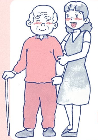
リハビリテーション

かしのき訪問看護ステーションは、ご自宅で看護が必要な方に、かかりつけの医師と提携し、訪問看護サービスを提供します。