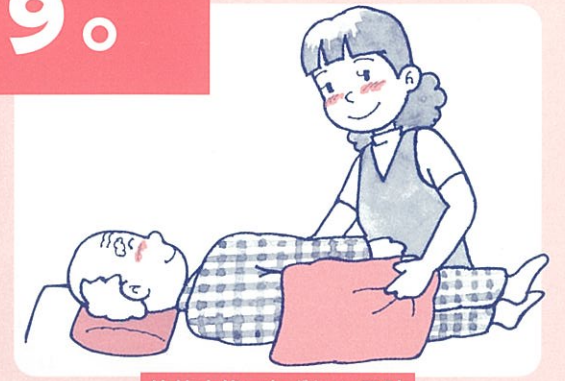
体位交換、床ずれの予防