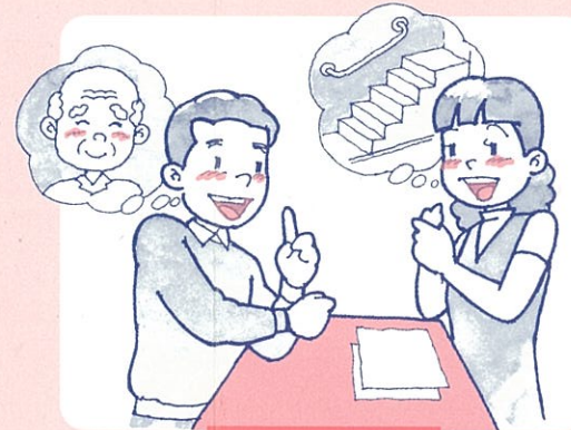
家族への介護指導