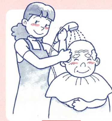
入浴、洗髪 食事、排泄の介助