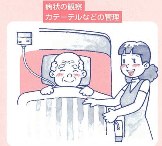
病状の観察 カテーテルなどの管理