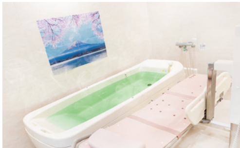
ゆったりとした浴室で、丁寧に入浴介助を行います。