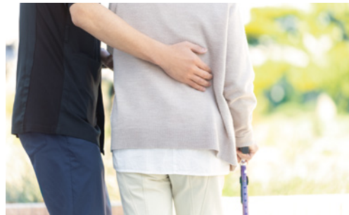
ホーム内を散歩して運動不足も解消。