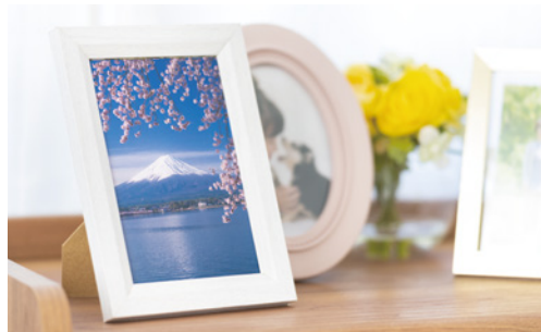
いつでも目が届く場所に、思い出の写真。