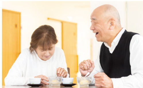
コンビニの移動販売車で好きなものを購入できます。