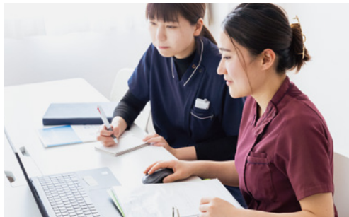
多職種でのカンファレンスでケア方針を検討します。