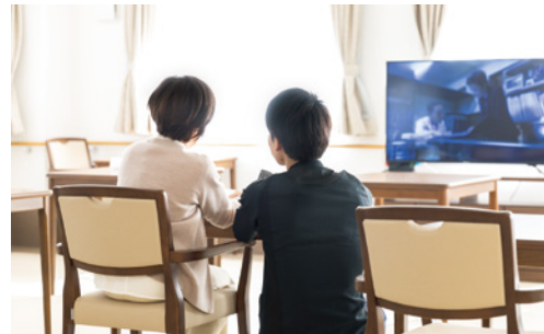
大好きなドラマを職員と一緒に。