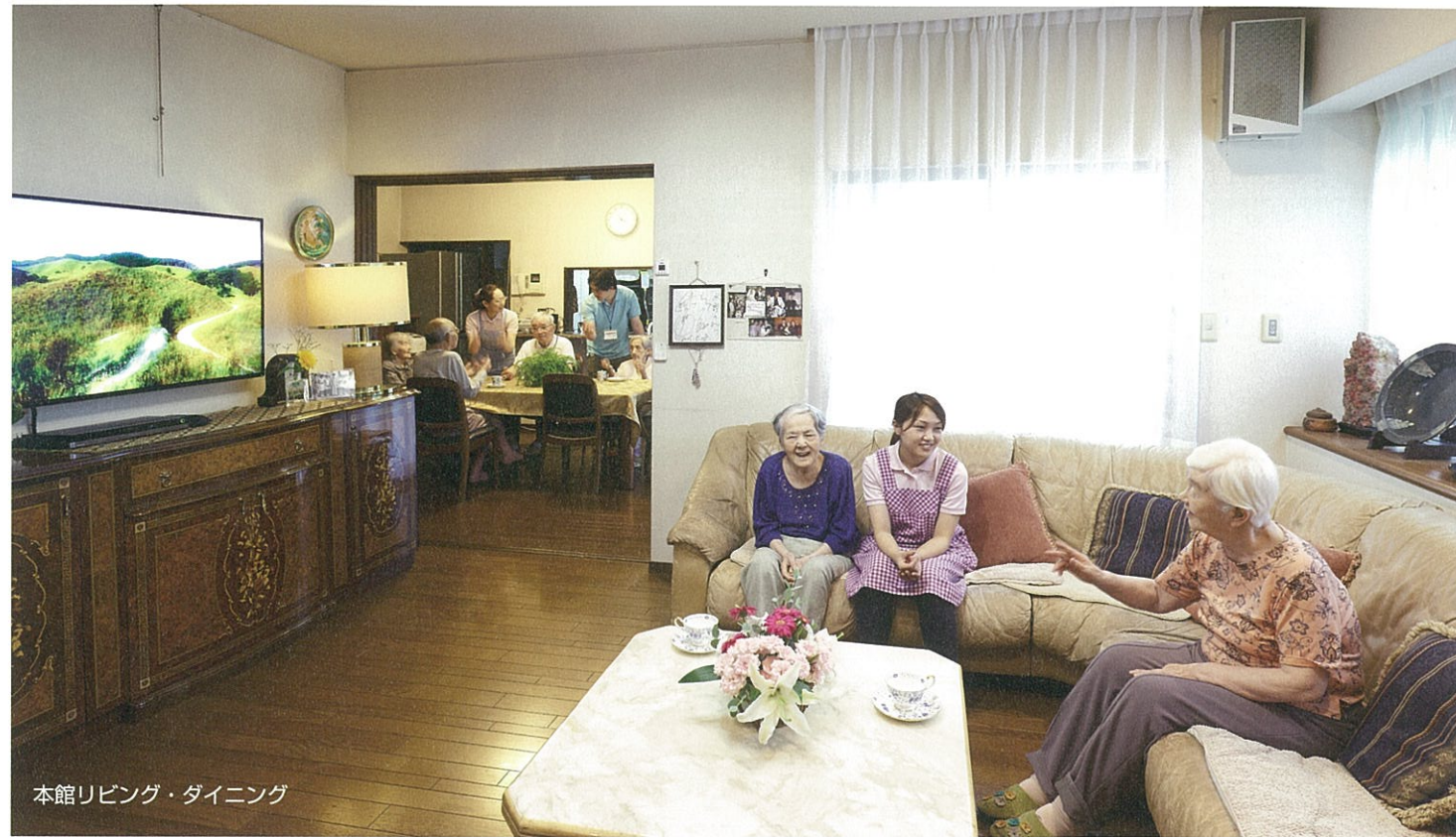
本館リビング・ダイニング