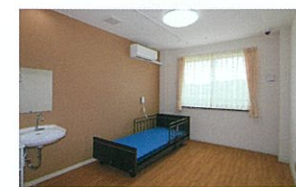
Bタイプ (トイレ共同個室)15.60㎡