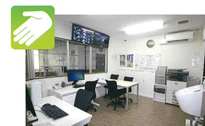
ヘルプステーション(1F・2F)

二重のカードキーによる認証によるみ入館することが可能なシステムを採用しており、防犯対策も万全です。