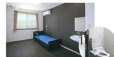
Aタイプ (トイレ付き個室)18.00㎡