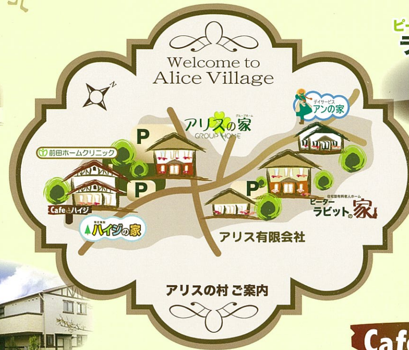
アリスの村ご案内