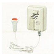
緊急呼出しボタン

全室にトイレ、洗面化粧台、緊急呼出しボタンを完備した完全な個室で、確かな安心とプライベートをお約束します。広々とした清潔なお部屋で、ご自分の時間を快適にゆったりとお過ごしいただけます。また、使い慣れた家具等の持ち込みもできますので、安心した生活空間でお過ごしいただけます。