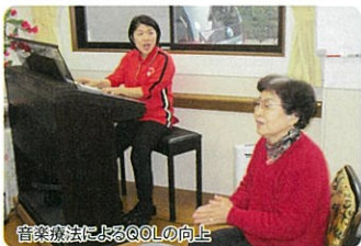
音楽療法によるQOLの向上