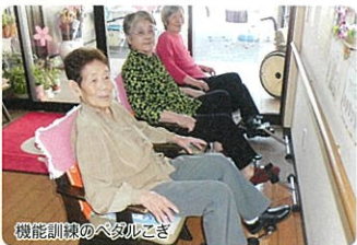
機能訓練のペダルこぎ