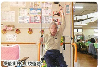
機能訓練(上肢運動)