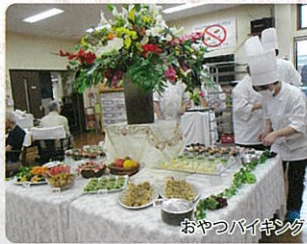
おやつバイキング