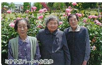
ミササガパークへお散歩