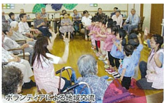
ボランティアによる地域交流