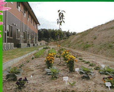
花壇・菜園スペース

開放的なリビングや、プライベートを守るトイレ付きの個室、 広い敷地を活用した花壇や菜園などもご用意させていただきました。 ご入居、おためし入居の相談、内部見学会も随時行っておりますので、 ぜひ一度、お気軽にお問い合わせ下さい。