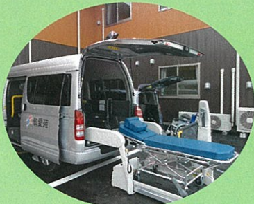
敬愛苑ワゴン車・ストレッチャー

家賃相当額 90,000円・管理費 42,000円・光熱水費 15,000円・ 食費 42,000円その他、日常生活費(オムツ、洗濯代)、個別医療費 などは必要に応じて実費をご負担願います。 別途、介護保険一割負担金が必要です。 《入居前費用》保証金 150,000円・事務手数料 100,000円