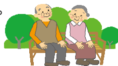
お花見やイチゴ狩