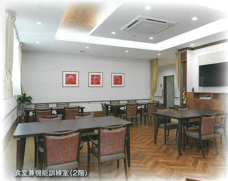
食堂兼機能訓練室(2階)