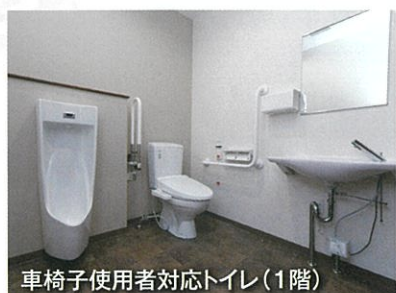
車椅子使用者対応トイレ(1階)