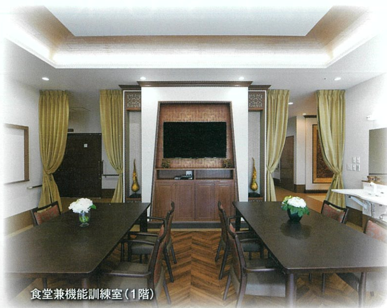
食堂兼機能訓練室(1階)