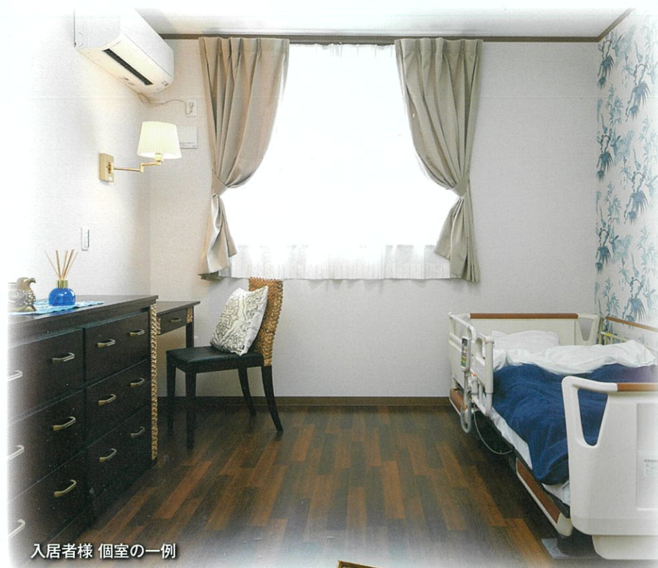
入居者様 個室の一例