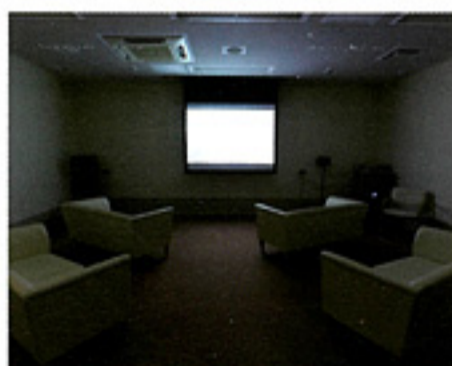
シアタールームで極上の寛ぎを