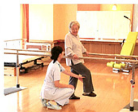
適度な運動で心も体もリフレッシュ