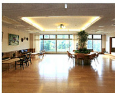
存在感のあるエントランス