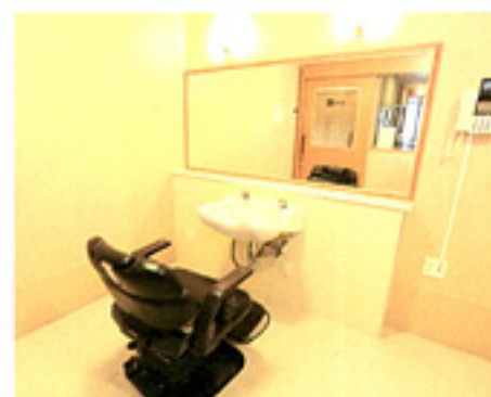
理美容室でおしゃれも忘れずに