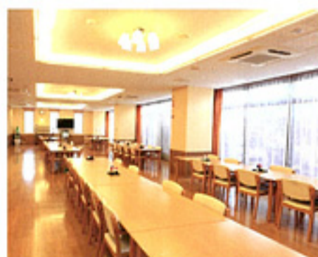
ゆったりスペースの食堂で食事が楽しみに