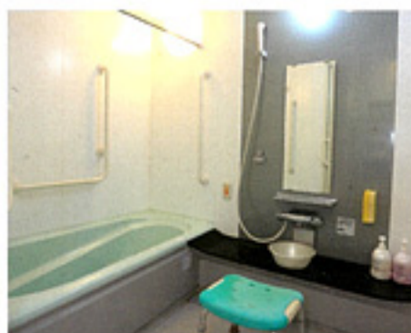
プライベート空間を満喫できる個室浴場も完備