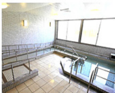
安全性を重視した人気の大浴場です